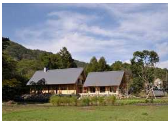
アファンセンター 全景

また、アファンセンターで使用するオフィス家具並びにテーブルやイス等の製作には、森を整備する際に伐採した材を利用しました。