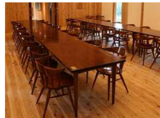
広葉樹を利用したイスとテーブル